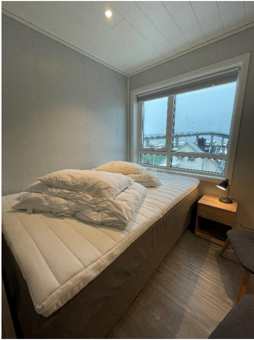
Dobbeltseng med fin utsikt og god lagringsplass under sengen.