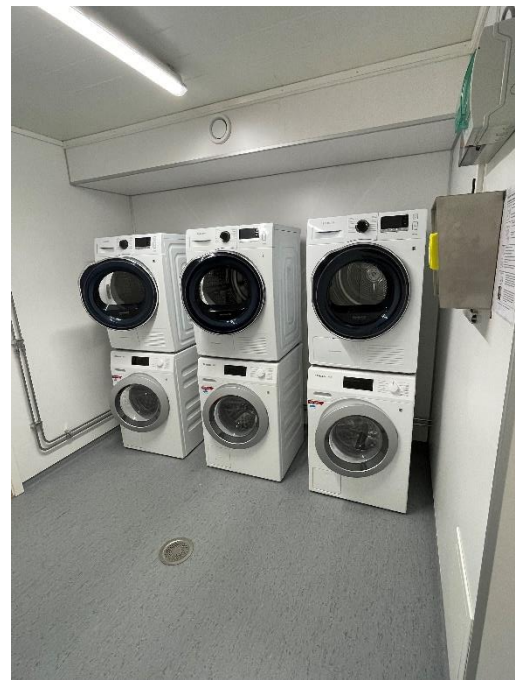
Eget vaskeri tilknyttet bygget.

Store gjennomgående vindusflater med skyvedør i glass gir godt med lys gjennom boenheten !