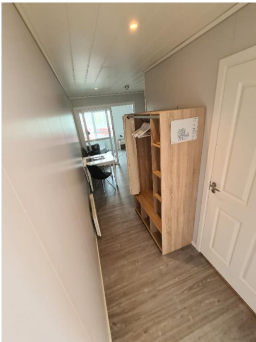
Gang med plass til oppbevaring.